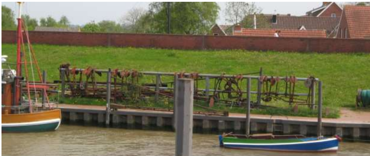
ankers bij haven van Ditzum