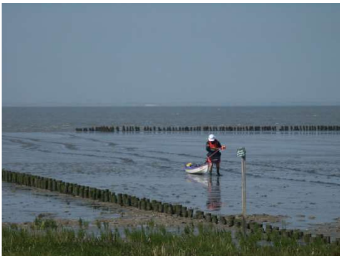
aankomen met laagwater bij Holwerd heeft zo zijn bezwaren...

rondje Ameland: moet nog ingevuld worden