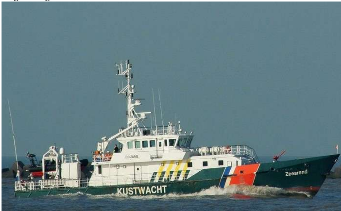
ms Zeearend van de kustwacht

Oefeningen met straaljagers op de Vliehors (Vlieland) worden gestaakt als er een schip langs vaart. Daarvoor moet je wel de observatiepost van tevoren op de hoogte stellen van je komst (0562-451315 of bgg de verkeerscentrale Brandaris (0562-442341). In Berichten aan Zeevarenden op www.hydro.nl/ worden de dagen van schietoefeningen langs het Wad ook aangekondigd.