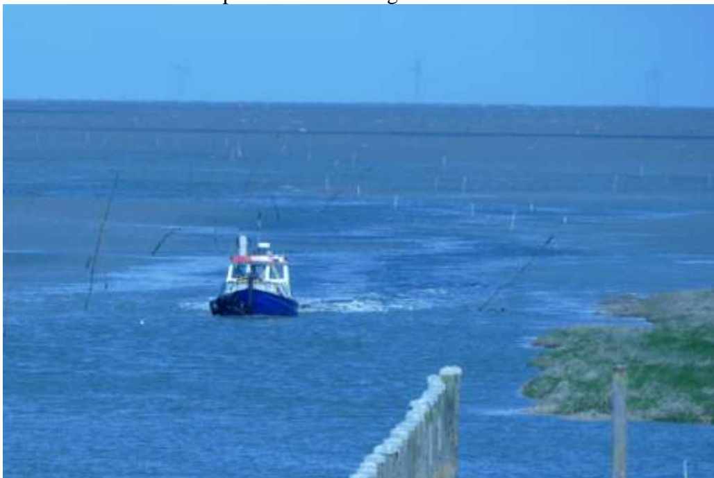
fig. 4. De sleepboot die de geul van Noordpolderzijl aan het ploegen is.

Een paar honderd meter van de haven komt het sleepbootje in de geul aanvaren terwijl hij door de geul ploegt (fig 4). Als ik het goed heb, is het de bedoeling dat bij hoogwater en afgaand tij de sleepboot de bodem omploegt en omwoelt en het slib met het afgaand water wordt meegevoerd naar de ZO-Lauwers. De hoop is dat op die manier de geul weer op een bevaarbare diepte wordt gebracht. Let ook op de witte stokken achter de boot die op korte afstand van elkaar de loop van de slenk aangeven.