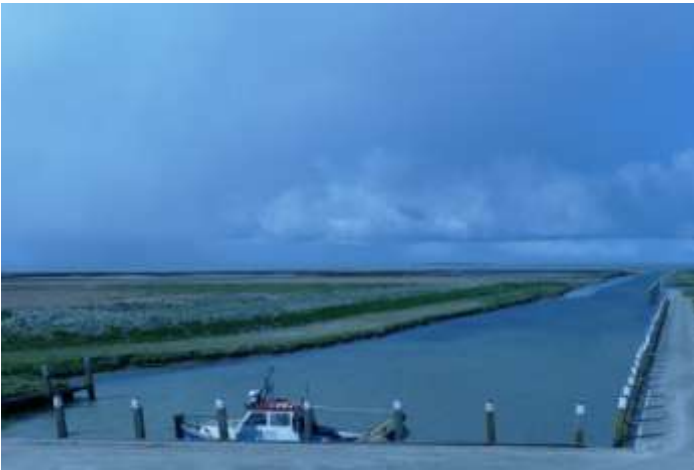
fig 5. Haventje Noordpolderzijl ca 3 uur na hoogwater

Na een koude wandeling over de kwelders kwam ik om 15.30, dus ca 3 uur na hoogwater weer bij het haventje aan. Het water was toen alweer een stuk gezakt, maar nog niet zo ver als ik 's morgens 3 uur voor hoogwater had aangetroffen (fig 5). Afgaand op de waterhoogten bij de harde oeverrand links (fig 6) lijkt het er op dat het water nog niet voor de helft is gezakt en er nog ca 50-75cm water staat. Dit is natuurlijk maar een schatting op z'n jan boeren fluitjes; een volgende keer zal ik een meetlint meenemen.