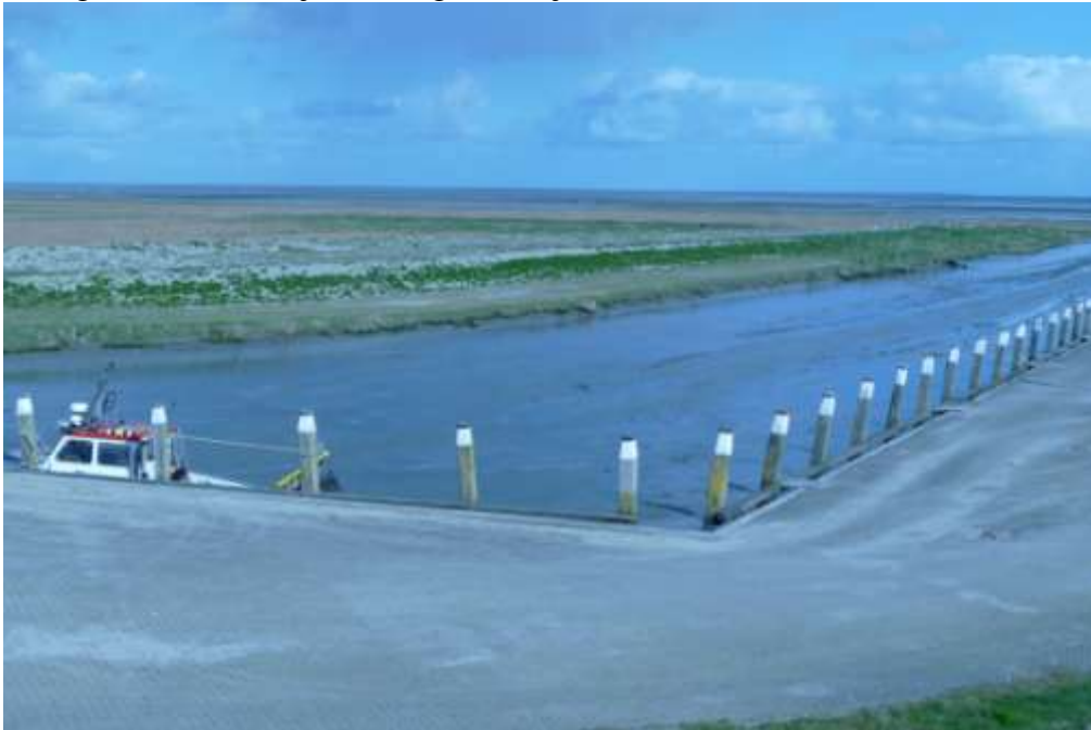
fig. 1. drooggevallen haven Noordpolderzijk 23-4-2016, 3 uur voor hoogwater

De Stichting Vrienden van Rottumeroog en Rottumerplaat hield zaterdag 23 april hun jaarlijkse donateursdag in het Zielhoes in Noordpolderzijk. Namens de Wadvaarders was ik uitgenodigd. Zodoende bracht ik een groot deel van de dag door bij het haventje van Noordpolderzijk en was ik in de gelegenheid om zelf te zien hoe het stond met het ploegen van het haventje en de geul. Volgens mijn eigen schattingen van de hoog- en laagwatertijdstippen voor Noordpolderzijk (zie Nautin) is het om 12.35 hoogwater. Om 9.40, dus 3 uur voor hoogwater ligt de haven praktisch droog (fig 1). In het midden loopt een geul met wat water (fig 2), maar geul en haven zijn dan nog duidelijk voor niemand bevaarbaar.