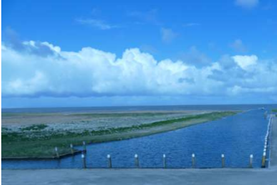
fig. 3. Haven van Noordpolderzijl 23-4-2016, vlak na hoogwater

Mijn schatting is dat er in het midden 1-1,5 m water staat.